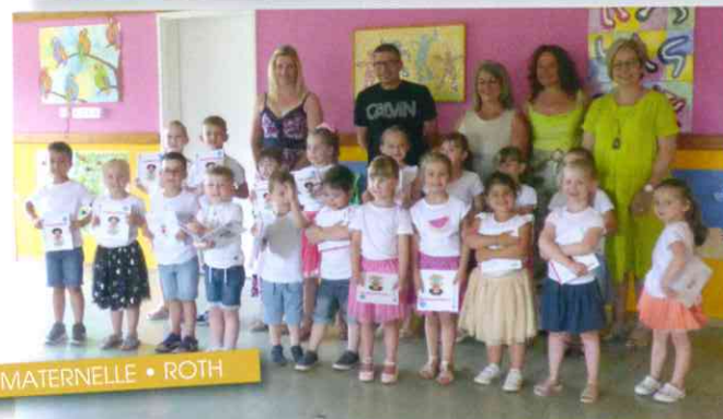
MATERNELLE • ROTH