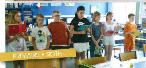
PRIMAIRE • ROTH