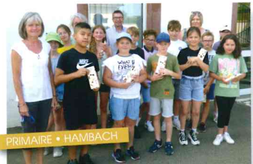
PRIMAIRE • HAMBACH