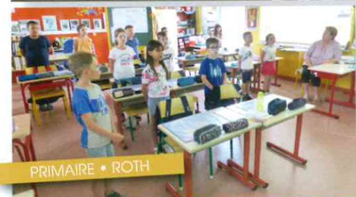
PRIMAIRE • ROTH