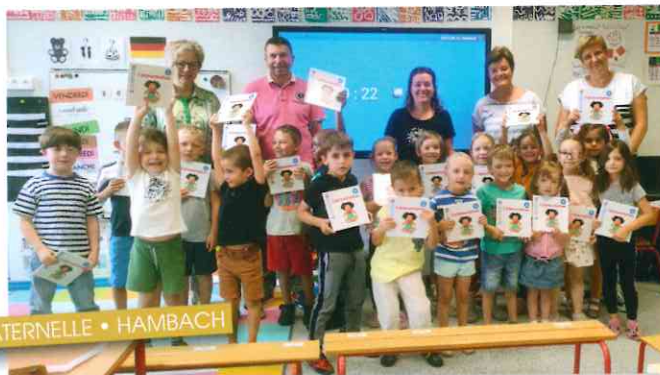
MATERNELLE • HAMBACH

Chaque classe, des maternelles aux CM2, Hambach comme Roth, a exécuté chants et danses avec éloquence, sous les applaudissements des élus et des familles et comme à l'accoutumée, la commune a offert à chaque élève du CM2 une calculatrice pour leur rentrée en 6 ème , et pour les élèves des autres classes un livre adapté à leur âge pour une petite occupation durant les vacances estivales.