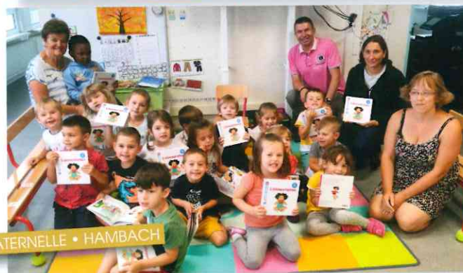
MATERNELLE • HAMBACH