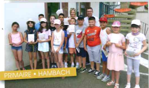
PRIMAIRE • HAMBACH